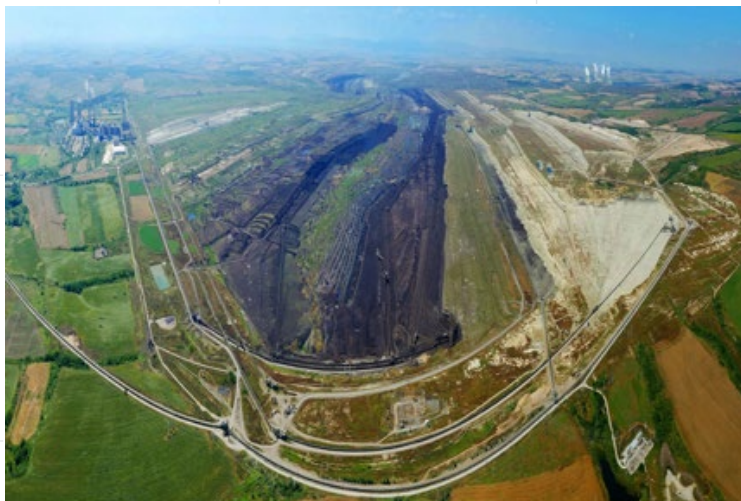
Въгледобивът в Маришкия басейн е обречен на закриване, но там може да се развива научна и развойна дейност

Добивната индустрия във всяка страна е въпрос на суверенитет. Не случайно добивът не е обект на приватизация или продажба, а на концесия. Но в последните 30 г. държавата изглежда повече като страничен наблюдател на процесите, а в много случаи се явява пречка. Има инвеститори, които чакат до 5 години за получаване на разрешение за търсе-