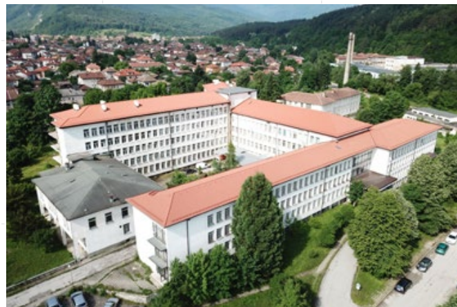
МБАЛ „Проф. д-р Ал. Герчев“ в Етрополе е с ремонтиран покрив по програмата „Българските добродетели“