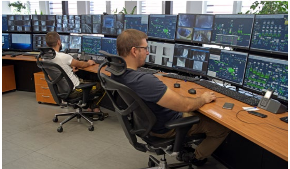
Компаниите от сектора непрестанно инвестират в нови технологии и иновации, но само институционална подкрепа може да гарантира развитие. На снимката: Сمارт центърът за управление на производството на „Дънди Прешъс Металс“ в Челопеч, заради който компанията получи международна награда за технологично лидерство на Mining magazine

И докато преодоляването на вътрешните трудности изглежда въпрос на воля на управляващите у нас, то по отношение на външните нещата не изглеждат така. От една страна, Зелената сделка изисква множество суровини, от друга, ЕС декларира желание за суровинна независимост. Това изглежда като рецепта за бърз успех на европейските компании, които се занимават с добив на метали. Възможностите за българската минна индустрия са свързани преди всичко с огромната нужда от мед за прехода към тотална електрификация. „Медта е изключително скъпа и прогнозите сочат, че с напредъка на енергийния преход ще става още по-скъпа, а ЕС е много зависим от внос. В такива условия добивът на мед е изключително печеливш бизнес – като произведена добавена стойност на зает изпреварва дори ИТ индустрията. Медта и медните изделия и сега дават 10% от нашия износ. Освен това медта може да бъде използвана и за производство на повече крайни изделия с по-висока стойност, като електромотори напри-